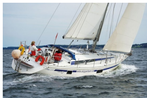
Gib' Sea 126 BAHIA SOL