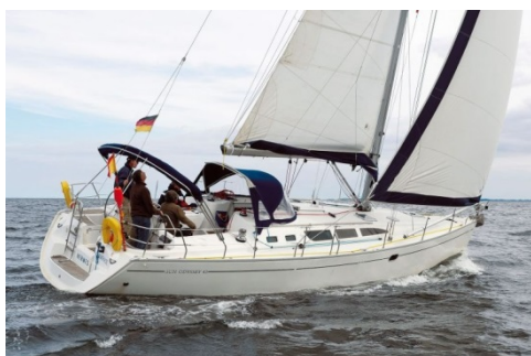
Jeanneau Sun Odyssey 43 HERMES

http://www.skipperteam.de/segeltoerns/mit-ausbildung.html